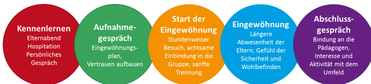
Abb. 5-1: Eingewöhnung in unsere Bambini Kinderkrippen

Wir orientieren uns eng an dem Berliner Eingewöhnungs-Modell. Selbstverständlich ist jede Eingewöhnung unterschiedlich, daher gehen wir auf die Bedürfnisse jedes Kindes und jeder Familie individuell ein.