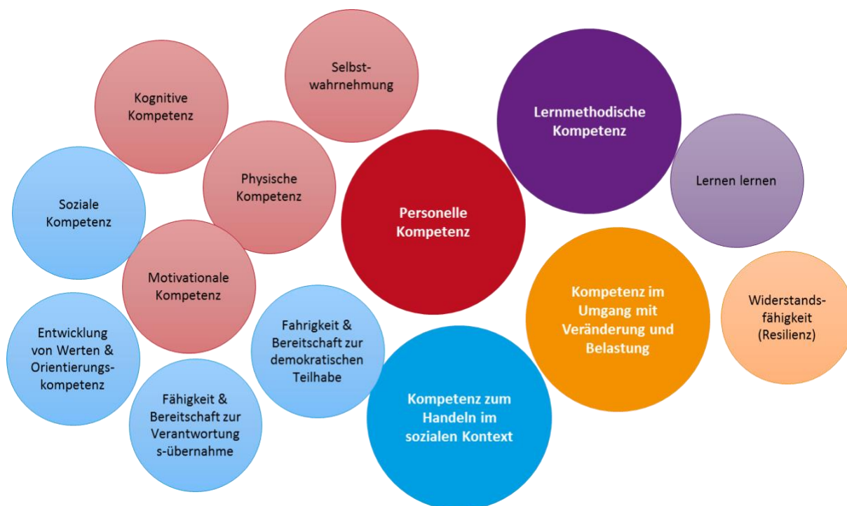
Abb. 2.2.-1: Basiskompetenzen nach dem BEP

Basiskompetenzen bilden das Fundament für nachhaltige und freudige Bildung. Ihnen zugrunde liegt die Annahme, dass jeder Mensch drei grundlegende Bedürfnisse hat: Er möchte sozial eingebunden sein und geliebt werden, eigene Entscheidungen treffen und etwas aus eigener Kraft können. Unsere Aufgabe ist es, die Kinder beim Erwerb dieser Kompetenzen zu unterstützen.